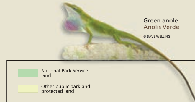
Green anole Anolis Verde