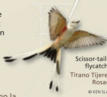
Scissor-tailed flycatcher Tirano Tijereta Rosado

La agricultura de las misiones se basaba en sistemas de acequia impulsados por la gravedad. Estos sistemas de riego utilizaban presas, acueductos y zanjas para desviar el agua del río San Antonio a los campos de cultivo. En la foto de arriba izquierdo, un guardaparques está levantando una compuerta en la misión San Juan. El acueducto Espada (arriba), al oeste de la misión San Juan, es el único acueducto español que queda en los Estados Unidos.