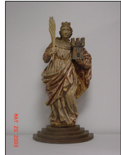
Santa Bárbara Escultura original del siglo XVII